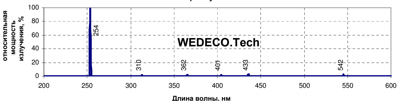
Спектр излучения лампы